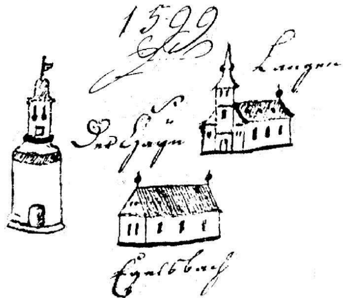
Abb. 2, Die frühere Langener Jakobskirche, das kleine Türmchen mit der Bezeichnung »der Hayn« und die Skizze des Egelsbacher Kirchleins aus dem Jahre 1599

Einen solchen Vergleich bietet eine Urkunde aus dem Jahre 1599 über die Veräußerung von Waldungen im Amt Kelsterbach. (Abb.2) Vergleicht man die Skizze der früheren Langener Jakobskirche und des kleinen Türmchens mit der Bezeichnung "der Hayn" mit noch vorhandenen späteren Darstellungen, so kann mit Fug und Recht auf eine vereinfachte, aber doch wahrheitsgetreue Wiedergabe geschlossen werden. Durch die gesicherte Jahresangabe "1599" kann es sich bei der Egelsbacher Kirchenskizze nur um die damals noch vorhandene mittelalterliche Kapelle handeln. Diese Kapelle war also keineswegs ein dominierendes Gebäude, das den Ortsmittelpunkt beherrschte, sondern ein eingeschossiger, rechteckiger Bau mit einem einfachen Satteldach. Angedeutet sind zwei zierende Aufbauten an den Giebelspitzen, vielleicht hing dort oben in einer der beiden Aufbauten das Glöckchen, das 1496 zur besagten Gerichtssitzung rief.