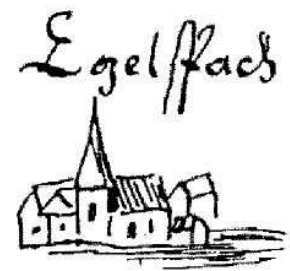
Abb. 3, Die Langener Jakobskirche und der 1614/15 entstandene Egelsbacher Kirchenbau

Ein weiterer schöner Beweis für die relativ hohe Genauigkeit solcher Ansichten auf historischen Plänen findet sich im Nachlass von Georg Wehsarg. Diese Skizze stammt aus der "acta der Langener und Egelsbacher Weydengerechtigkeit in den Ysenburger Waldungen ..." aus dem Jahre 1663/1664. Auch hier zeigt sich, dass die Ortsansichten von den Zeichnern der Pläne keineswegs frei erfunden worden sind (Abb. 3). Zu sehen ist wiederum die Langener Jakobskirche und der 1614/15 neu erstandene Egelsbacher Kirchenbau mit dem charakteristischen Dachreiter.